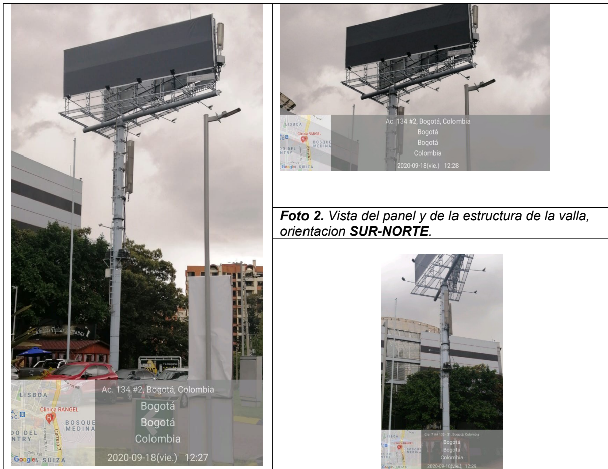
Foto 2. Vista del panel y de la estructura de la valla, orientación SUR-NORTE .